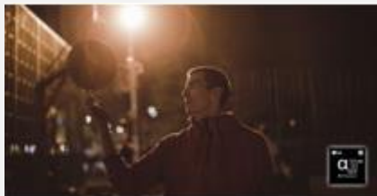
Processeur α9 Gen 5 AI 4K

Intertek, l'agence de test internationale, a certifié que les écrans OLED LG offrent une cohérence des couleurs de 100 %. Cela signifie que les couleurs qui s'affichent à l'écran correspondent fidèlement aux couleurs de l'image d'origine. Ainsi, tous les contenus que vous regardez correspondent à la vision qu'avait originellement le réalisateur.