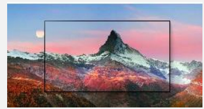
Cohérence des Couleurs

L'OLED est la technologie ultime pour les téléviseurs en matière de qualité d'image. En effet, la technologie OLED dispose de millions de pixels auto-émittifs capables de créer un noir absolu et des couleurs fidèles. Le résultat ? Une expérience et une immersion uniques.