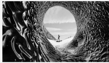
Noirs absolus et Contrastes riches

Magnifier la puissance des pixels auto-émittifs avec LG OLED evo. La technologie Brightness Booster offre jusqu'à 20% de luminosité supplémentaire* grâce à la gestion ultra précise du processeur α9 Gen 5 AI 4K. Désormais, les images sont incroyablement éclatantes grâce à une puissance lumineuse décuplée.