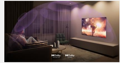
Dolby Vision IQ & Atmos

Le processeur α9 Gen 5 AI virtualise une source audio 2 canaux en un son immersif 7.1.2. Vivez l'action et le chaos autour de vous, comme si vous étiez le personnage principal du film.