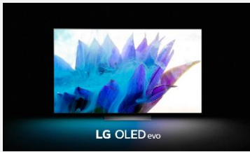
LG OLED evo

Magnifier la puissance des pixels auto-émittifs avec LG OLED evo. La technologie Brightness Booster offre jusqu'à 20% de luminosité supplémentaire* grâce à la gestion ultra précise du processeur α9 Gen 5 AI 4K. Désormais, les images sont incroyablement éclatantes grâce à une puissance lumineuse décuplée.