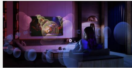
Virtualisation son 7.1.2

Développé par LG, le processeur α9 Gen 5 est le cerveau de votre téléviseur. La qualité d'image est optimisée : les couleurs sont plus riches et les scènes plus détaillées.