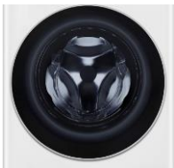
Hublot verre trempé