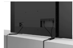
Passage de câbles intégré