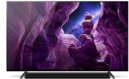
Pieds en position haute pour barre de son