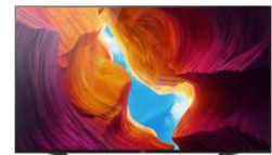
Pieds en position central