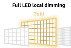
Local Dimming Gold

Le nouveau processeur ultra-puissant utilise l'Intelligence artificielle pour transformer tous vos contenus en 4K et optimiser les différents réglages de luminosité et de son.