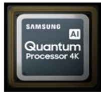
Quantum Processor 4K

La technologie Quantum Dots capte la lumière et restitue une palette de couleurs d'un réalisme incomparable qui ne se dégrade pas au fil du temps. Compatible HDR10+, les Q95T atteignent des pics de luminosité jusqu'à 2000 nits .