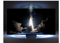
OTS (Object Tracking Sound)*

Un rétroéclairage Direct LED associé à la technologie Local Dimming Gold qui permet un contraste élevé et des détails précis.