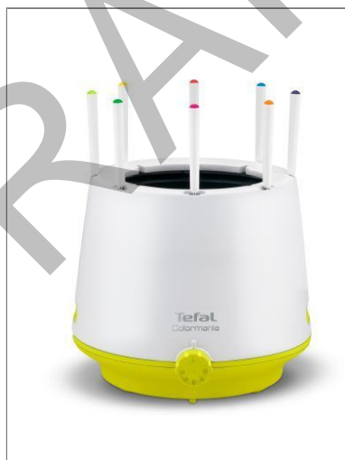
FONDUE THERMORESPECT COLORMANIA FONDUE COLORMANIA 8 PERSONNES EF260312

Dégustez tous les types de fondues en toute sécurité grâce à son socle isolant !