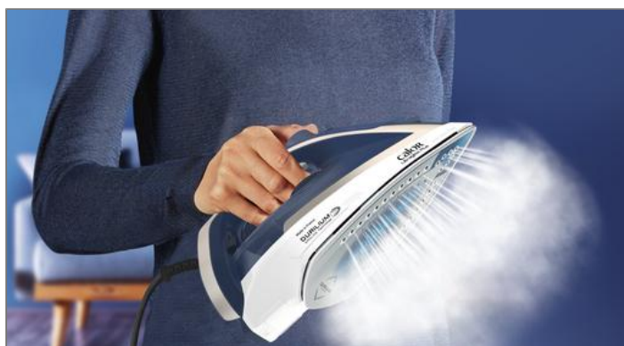
ULTRAGLISS PLUS 2800 W BLEU/ARGENT FER A REPASSER FV6812C0