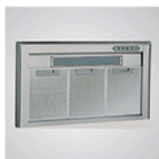
Vue de dessous